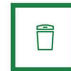
Είδη σπιτιού & κήπου