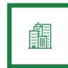
Κατασκευαστικά είδη & σωλήνες