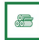
Είδη & φιλμ συσκευασίας