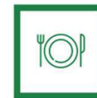
Δοχεία τροφίμων μιας χρήσης