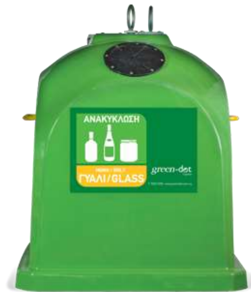
Κάδοι ανακύκλωσης γυαλιού