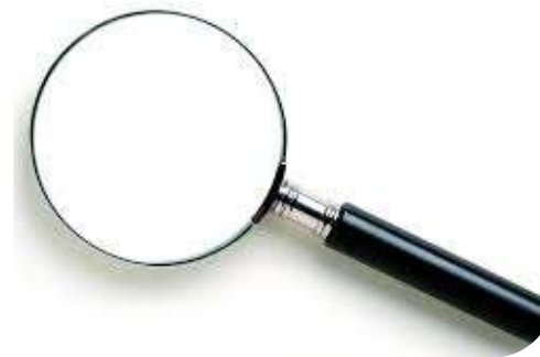
Audits & PenTests