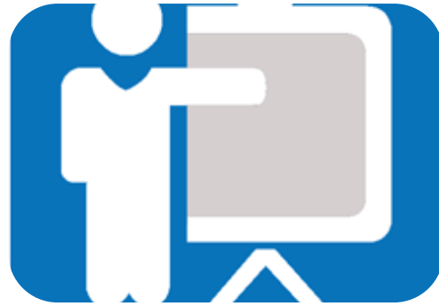
Information Security Consulting