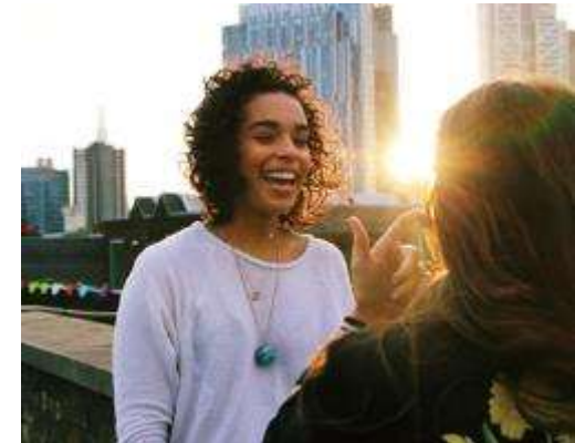
Comply with Security Standards