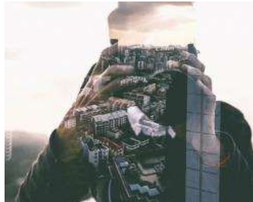
Network Video Surveillance and Advanced Applications