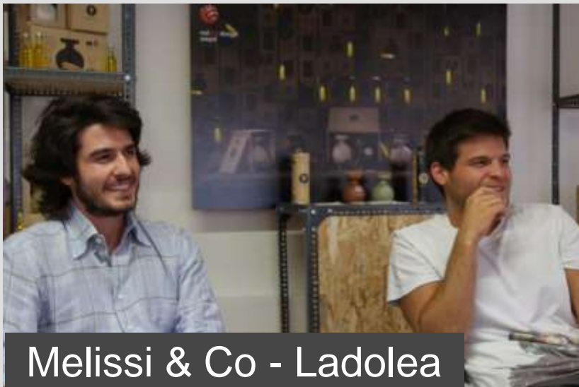
Melissi & Co - Ladolea